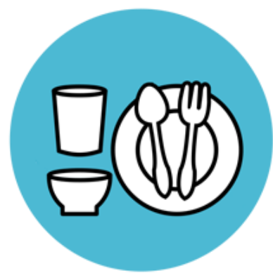
持参した飲食物の持ち帰り