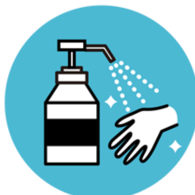
こまめな手洗い・手指の消毒