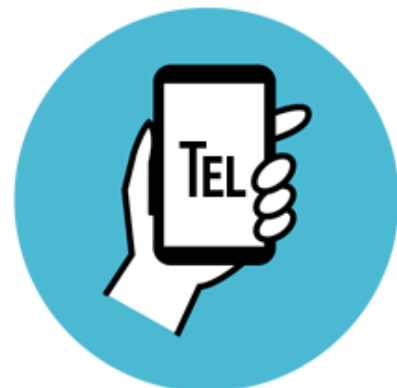
事務局との情報共有