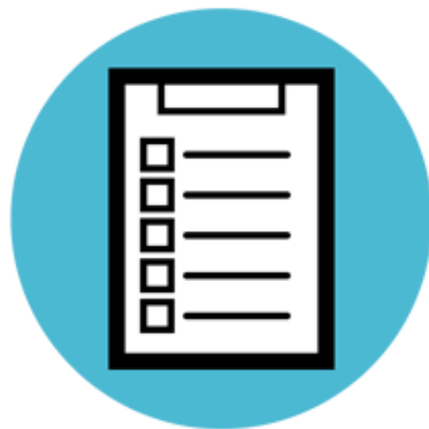
ガイドラインの確認